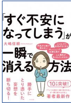
「すぐ不安になってしまう」が一瞬で消える方法 大嶋 信頼/著 すばる舎/刊

※新着図書は他にも多数あります。絵本・児童書は「としよかんだより 子ども版」で紹介しています