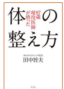
97歳現役医師が悟った体の整え方 田中 旨夫/著 幻冬舎/刊