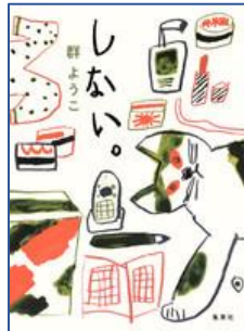
しない。 群 ようこ/著 集英社/刊