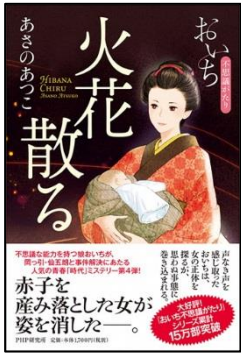
火花散る あさの あつこ/著 PHP研究所/刊