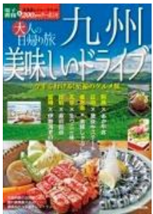
大人の日帰り旅 九州美味しいドライブ JTBパブリッシング/刊