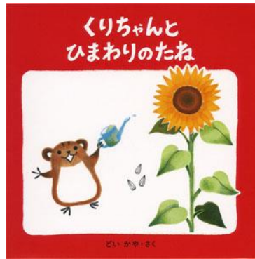
どい かや／さく ポプラ社刊