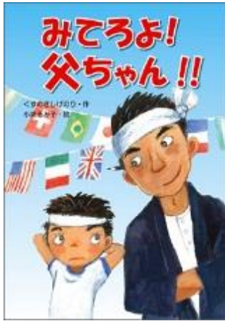
くすのきしげのり／作 小泉み子／絵 文溪堂刊