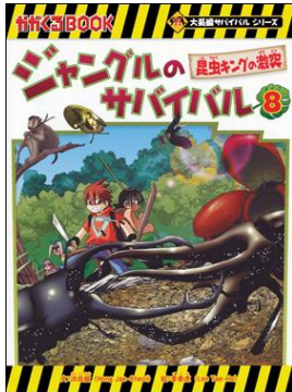
ジャングルのサバイバル 8 洪 在徹/文 朝日新聞出版/刊