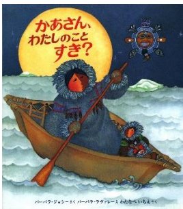
かあさん、わたしのことすき? バーバラ・ジョシー/さく 偕成社/刊