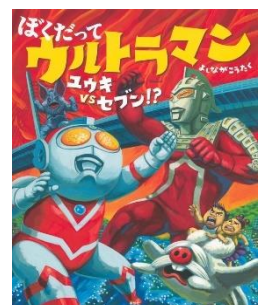
ぼくだってウルトラマン よしなが こうたく/作 講談社/刊