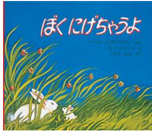
ぼくにげちゃうよ マーガレット・W・ブラウン/ぶん ほるぷ出版/刊