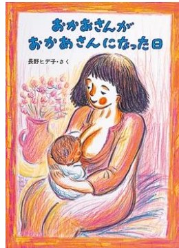
おかあさんがおかあさんになっ た日 長野 ヒデ子/さく 童心社/刊