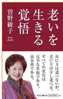
老いを生きる覚悟 曾野 綾子／著 海竜社／出版