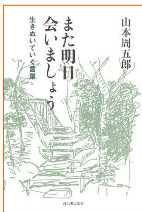
また明日会いましょう 山本 周五郎／著 河出書房新社／出版