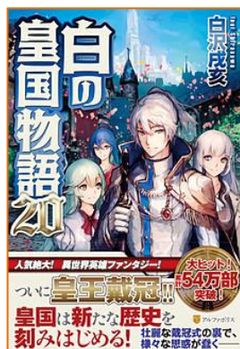
白の皇国物語 20 白沢 戊亥／著 アルファポリス／出版