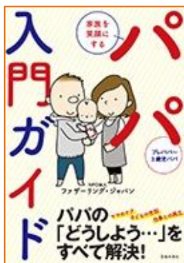
パパ入門ガイド ファザーリング・ ジャパン／著 池田書店／出版