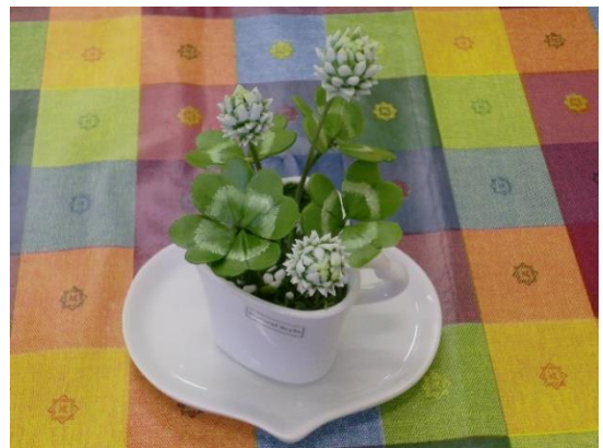
体験作品「happy クローバー」