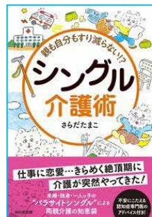
親も自分もすり減らない！？ シングル介護術 さらだ たまこ／著 WAVE出版／刊