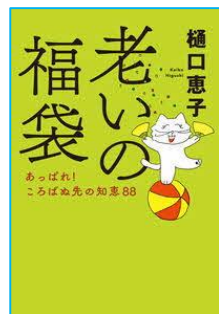
老いの福袋 樋口 恵子／著 中央公論新社／刊

「認知症」という病気について少し理解をすることで、あなたの大切な人にやさしい気持ちになれると思います。対応の仕方が変わると、お互いストレスなく過ごせるかもしれません。