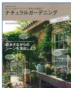
ナチュラルガーデニング 学研パブリッシング／刊

初心者でもできる庭づくりや寄せ植えのヒント満載の本をご紹介します！ 近場のホームセンター通いが楽しみになりそうです。