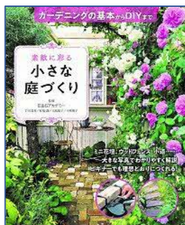
素敵に彩る 小さな庭づくり E & G アカデミー／監修 西東社／刊