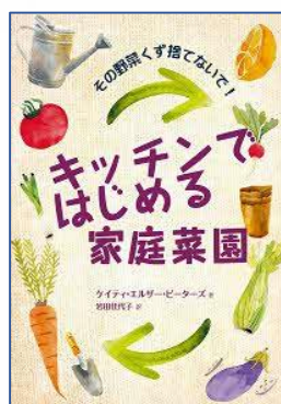
キッチンではじめる 家庭菜園 ケイティ・エルザー・ ピーターズ／著 ガイアブックス／刊