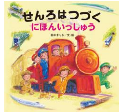
せんろはつづくにほん いっしゅう 鈴木 まもる/文・絵 金の星社/刊