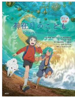
神在月のこども 四戸 俊成/原作 講談社/刊