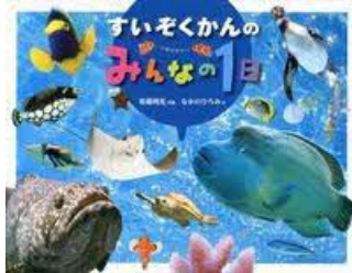
すいぞくかんの みんなの1日 松橋 利光/写真 アリス館/刊