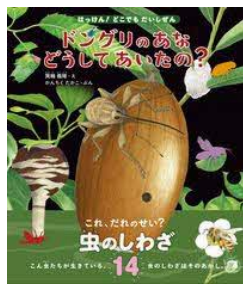
ドンダリのあな どうして あいたの? 箕輪 義隆/え 文一総合出版/刊