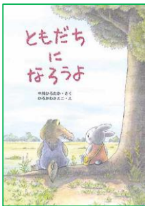
ともだちになろうよ 中川 ひろたか/さく アリス館/刊