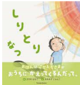
しりとりなつ ささき はなこ/さく パレード/刊