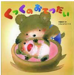
くっくのおてつだい 中島 和子/原作 ひかりのくに/刊