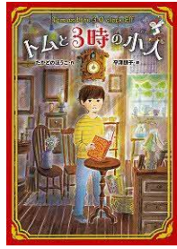
トムと3時の小人 たかどの ほうこ/作 ポプラ社/刊