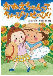
おねえちゃんって、ちよっぴりせのび! いとう みく/作 岩崎書店/刊