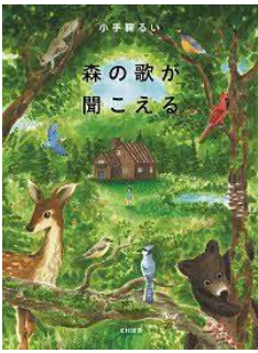
森の歌が聞こえる 小手鞠 るい／著 光村図書出版／刊