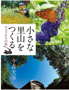
小さな里山をつくる 今森 光彦／著 アリス館／刊