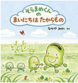
そらまめくんのまいにちは たからもの なかや みわ／さく 小学館／刊