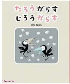
たろうがらす じろうがらす かこ さとし／著 復刊ドットコム／刊