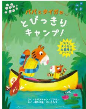
パパとタイガの とびつきりキャンプ! セバスチャン・ブラウン／さく 教育画劇／刊